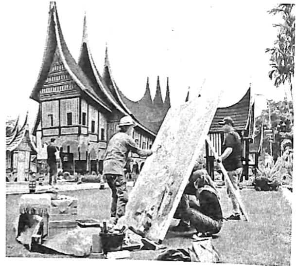
AKTIVITAS pegiat seni di kawasan Pusat Dokumentasi dan Informasi Kebudayaan Minangkabau (PDIKM) Padang Panjang

"Harapan kami, kunjungan wisata ke PDIKM semakin meningkat. Tidak hanya domestic, namun juga kunjungan dari luar negeri yang selalu ramai sebagai mana sebelum pandemi Covid-19 melanda," tuturnya. (mas)